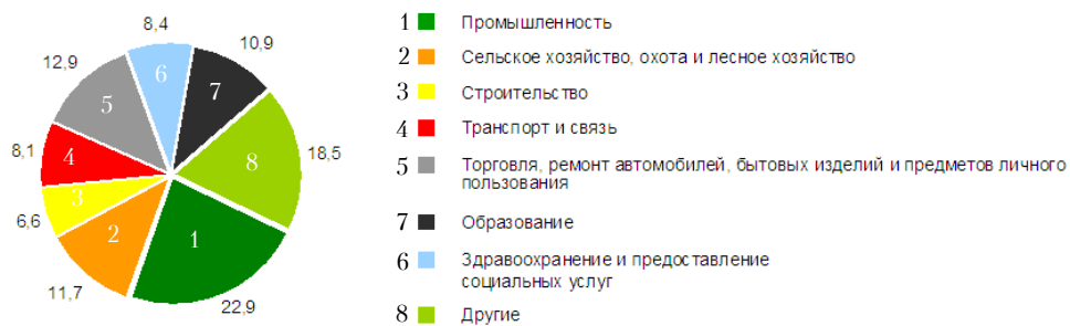
Рис. 2 – Распределение численности занятого населения Витебской области Республики Беларусь по видам экономической деятельности в 2015 году, в % к итогу [16]

В структуре занятости населения Витебской области (рисунок 2) доминирующими видами экономической деятельности по данным 2015 г. являются: промышленность (22,9%); транспорт, ремонт автомобилей, бытовых изделий и предметов личного пользования (12,9%); сельское хозяйство, охота и лесное хозяйство (11,7%); образование (10,9%) и др.