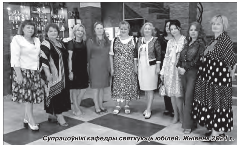
Супрацоўнікі кафедры святкуюць юбілей. Жнівень 2021 г.