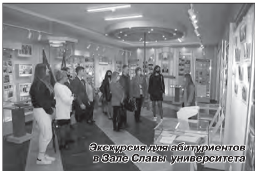
Экскурсия для абитуриентов в Зале Славы университета

В этом году Дню знаний предшествовало важное событие, которое касается каждого из нас – это состоявшийся 23–24 августа 2021 года Республиканский педагогический совет с участием Главы государства. Один из главных постулатов резолюции педагогического совета – политика и идеология в учреждении образования может быть только одна – государственная, и именно в русле государственной политики и идеологии мы обязаны воспитывать наших студентов и слушателей. Напомню и второй постулат – формировать социально-личностные компетенции патриота и гражданина Республики Беларусь не только на отдельных мероприятиях воспитательного характера, но через преподавание дисциплин учебной нагрузки на каждой лекции, семинаре, лабораторной работе или практике.