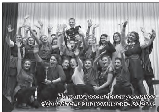
На конкурсе первокурсников «Давайте познакомимся», 2020 г.

Университет проводит фундаментальные и прикладные исследования по 5 основным научным направлениям, действовало 7 научных школ, выполнялось 17 НИР в 5 ГПНИ и 2 студенческих гранта Министерства образования Республики Беларусь. В 2021 г. выполняются 12 заданий в 3 ГПНИ, 2 аспи-