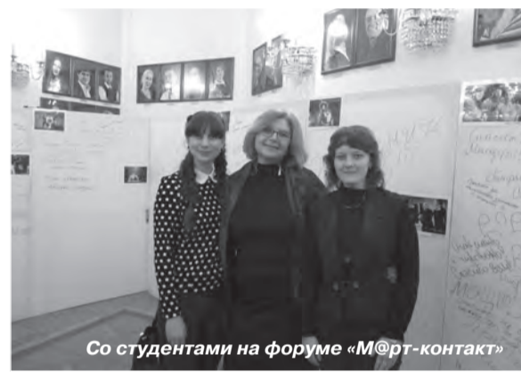
Со студентами на форуме «М@рт-контакт»

Конечно, не надо меня считать ретроградом. Я понимаю, время идёт, требования меняются. У нас компьютеров не было – были книги. Но суть