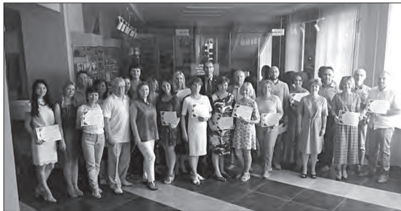
Выпускники первых обучающих курсов по английскому языку для преподавателей

рейтинговой системы является ее антикоррупционная направленность: системная работа в семестре не предполагает сложности при сдаче студентом экзамена, зачета.