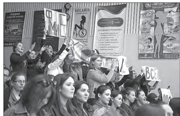
Группа поддержки факультета математики и естествознания