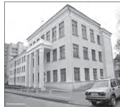
Будынак СШ № 16