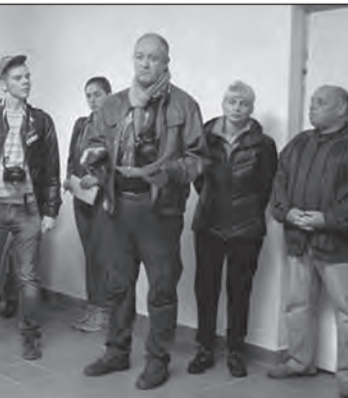
Занятия в школе «Лидер»

Приоритетным направлением в запланированной идеологической и воспитательной работе является активная деятельность информационно-пропагандистских групп, организация и проведение единых дней информирования. При грамотном проведении информационно-пропагандистской работы у студентов формируется правильное мировоззрение, убеждения, представления,