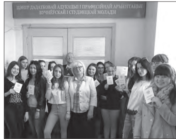
Выпускники Центра дополнительного образования и профориентации

Среднегодовой контингент слушателей по ИПКиП в прошлом учебном году составил 408,8 чел., в том числе на специальностях переподготовки и направлениях повышения квалификации — 239,4 чел. (в 2015/2016 уч. г. — 200,2 чел.). Более чем на 20% за прошлый учебный год выросло число слушателей по образовательным программам курсовой подготовки — с 151 до 186 чел. Всеми образовательными программами для взрослых (кроме переподготовки и повышения ква-