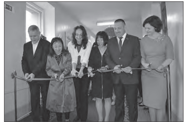
Открытие Центра китайского языка и культуры

географию государств, вместе с отделом международных связей университета, Институт планирует расширить. Уже в прошлом учебном году осуществлен первый выпуск 15 иностранных слушателей программы переподготовки «Современный иностранный язык в сфере внешнеэкономической деятельности», что позволило уни-