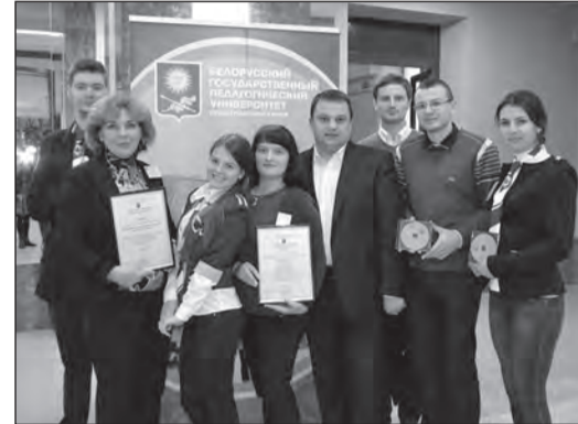
Команда студентов факультета педагогики и психологии детства