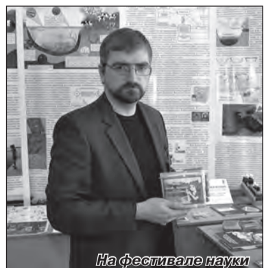
На фестивале науки