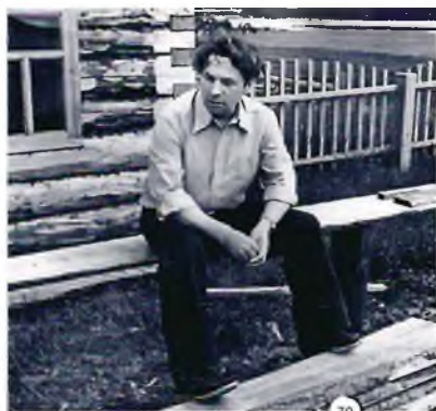
АЛЕКСАНДРОВСКИЙ ИСТОРИЧЕСКИЙ МУЗЕЙ