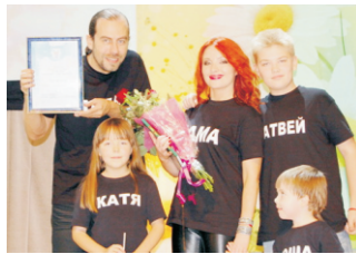
Вручение диплома 1 степени на Республиканском конкурсе «Семья года».

генеральным продюсером ВИДа, на прямые эфиры программы «Час Пик» в качестве выпускающего режиссера. Ей было 24 года, когда она командовала эфиром одной из самых популярных программ России. По ходу монтировала для ВИДа праздничные анонсы, промо-ролики, демонстрационные фильмы. В общем, работы хватало. Умудрялась подрабатывать режиссером и ведущей программы «КлипСа» на канале «Телеэкспо».