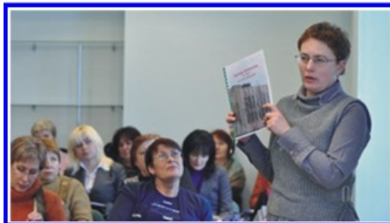
Участники школы делятся опытом

Тема внедрения и сопровождения СМК остается актуальной для наших библиотек, несмотря на то, что многим вузам уже вручены сертификаты соответствия.