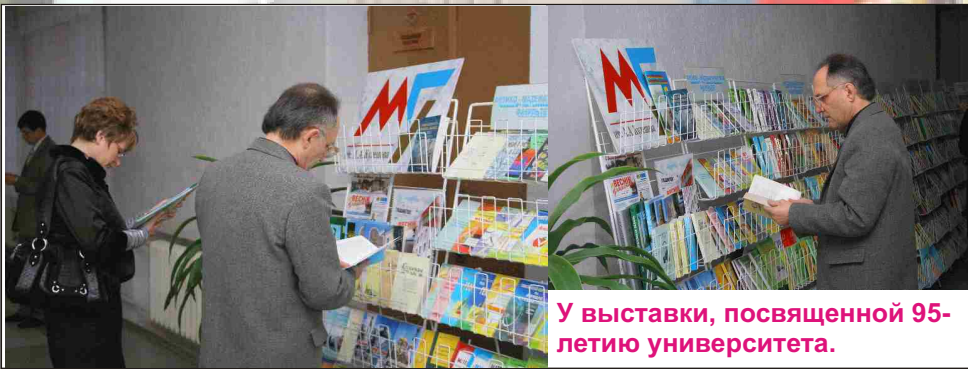
У выставки, посвященной 95-летию университета.