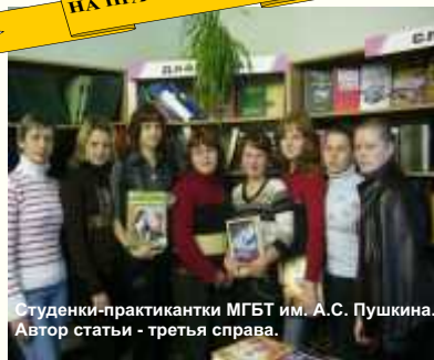
Студенки-практикантки МГБТ им. А.С. Пушкина. Автор статьи - третья справа.