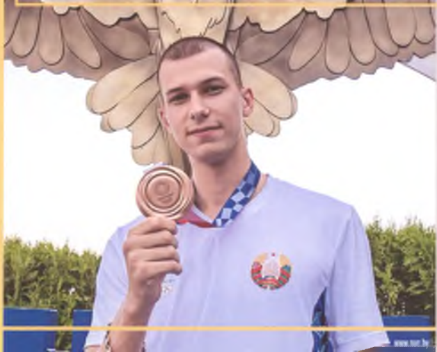
Максим Недосекон – бронзовый призер Токио-2020 (легкая атлетика)